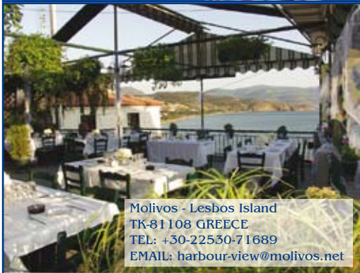
Molivos - Lesbos Island TK-81 108 GREECE TEL: +30-22530-71689 EMAIL: harbour-view@molivos.net