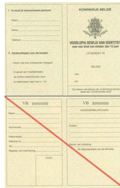
(De voorlopige identiteitskaart voor kinderen)

Dus vertrek je eerder dan de wachttijd van 3 tot 4 weken dan kan een voorlopige identiteitskaart een oplossing vormen – niet alle landen aanvaarden die echter – doe navraag bij de ambassade van uw bestemming.